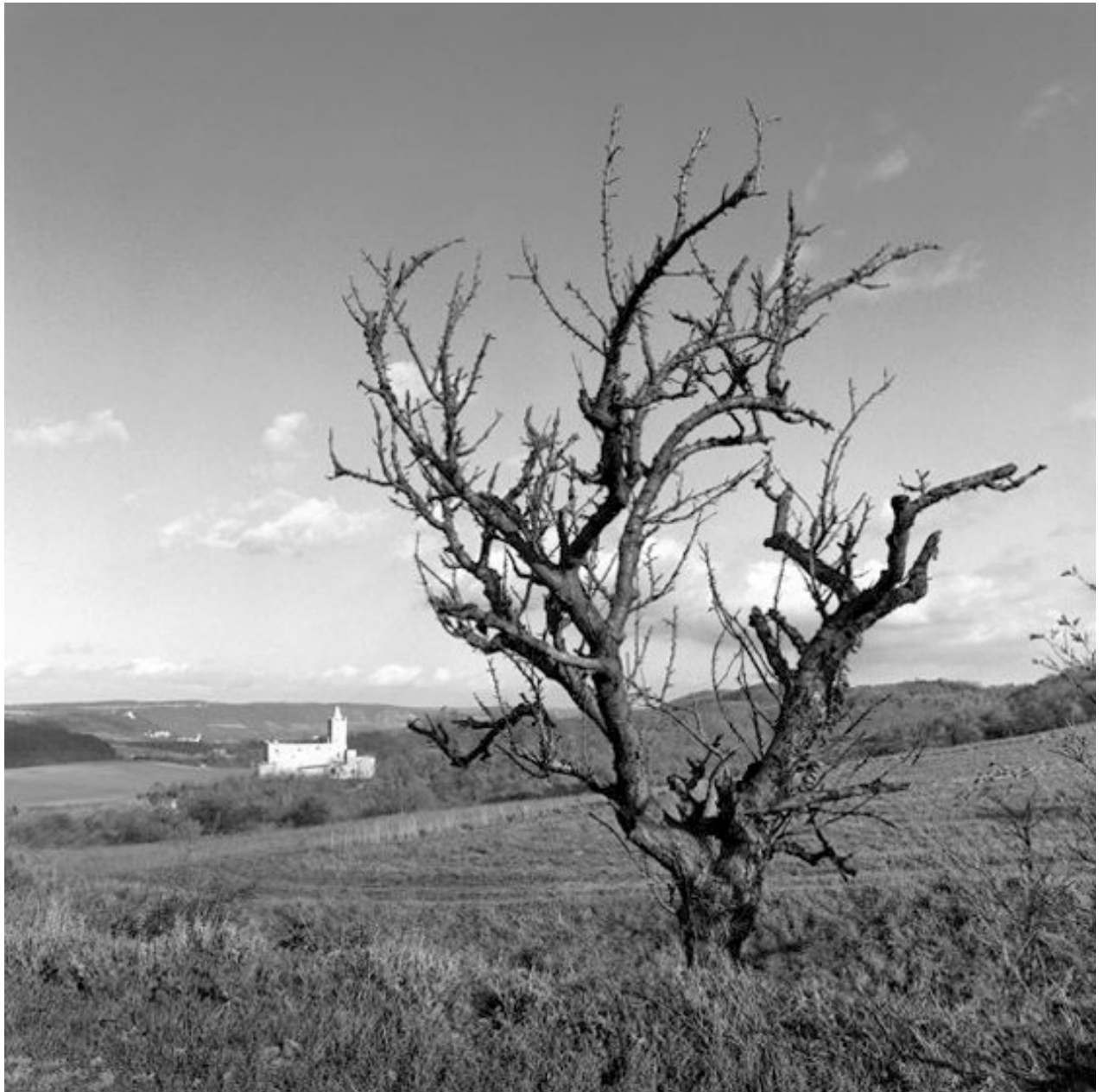
Thomas Steinert, Das Saaletal mit der Rudelsburg , 1990–95, Silver Gelatin Print, 40 x 40 cm, Edition 7

Foto-Essay über die letzten Lebensjahre des Dichters Ernst Ortlepp [1800—1864]