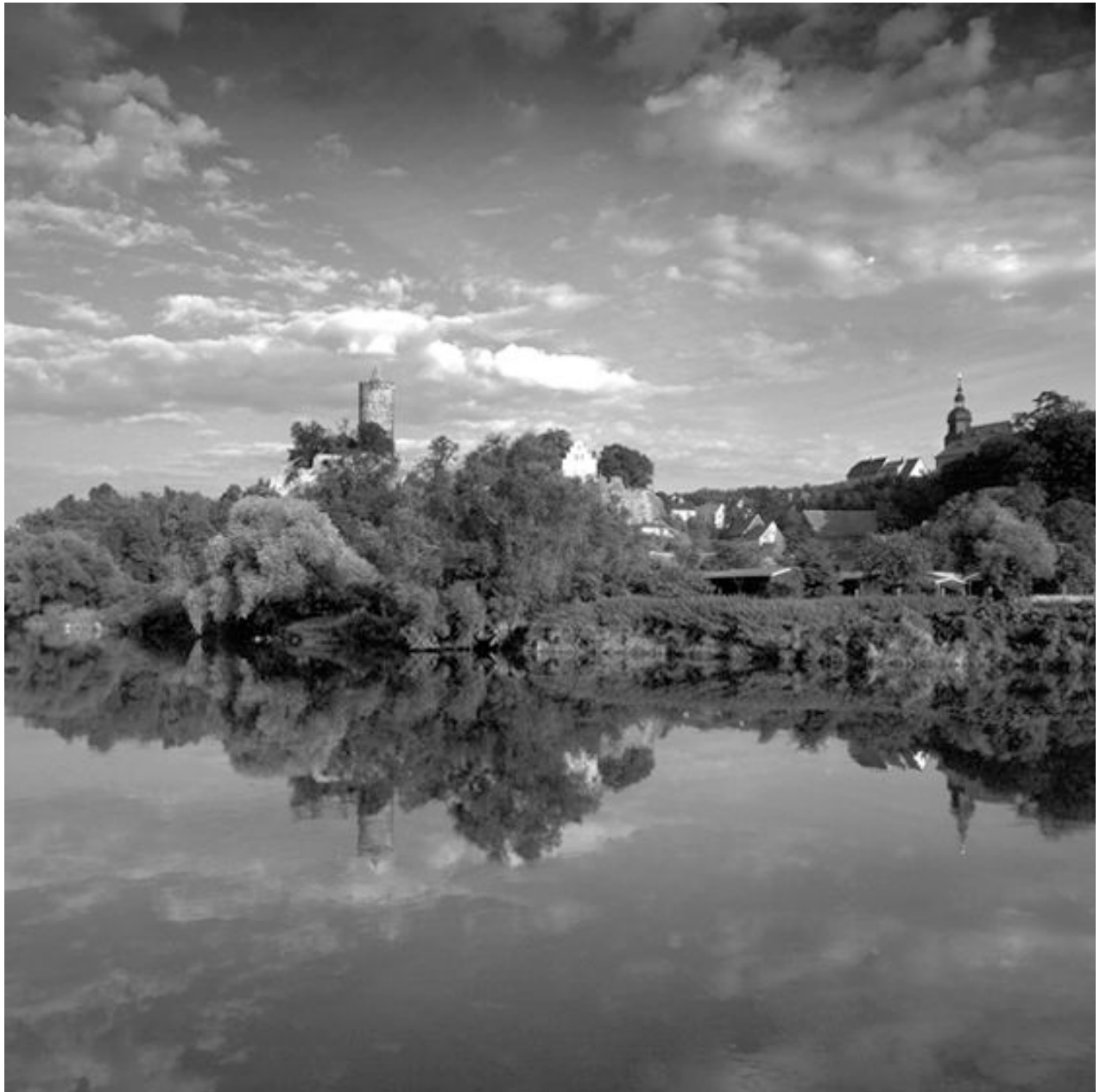
Thomas Steinert, Die Schönburg an der Saale , 1990–95, Silver Gelatin Print, 40 x 40 cm, Edition 7

Foto-Essay über die letzten Lebensjahre des Dichters Ernst Ortlepp [1800—1864]