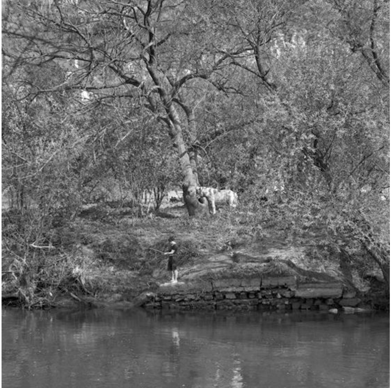
Thomas Steinert, Das Saaleufer am Blüthengrund , 1990–95, Silver Gelatin Print, 40 x 40 cm, Edition 7

Foto-Essay über die letzten Lebensjahre des Dichters Ernst Ortlepp [1800—1864]