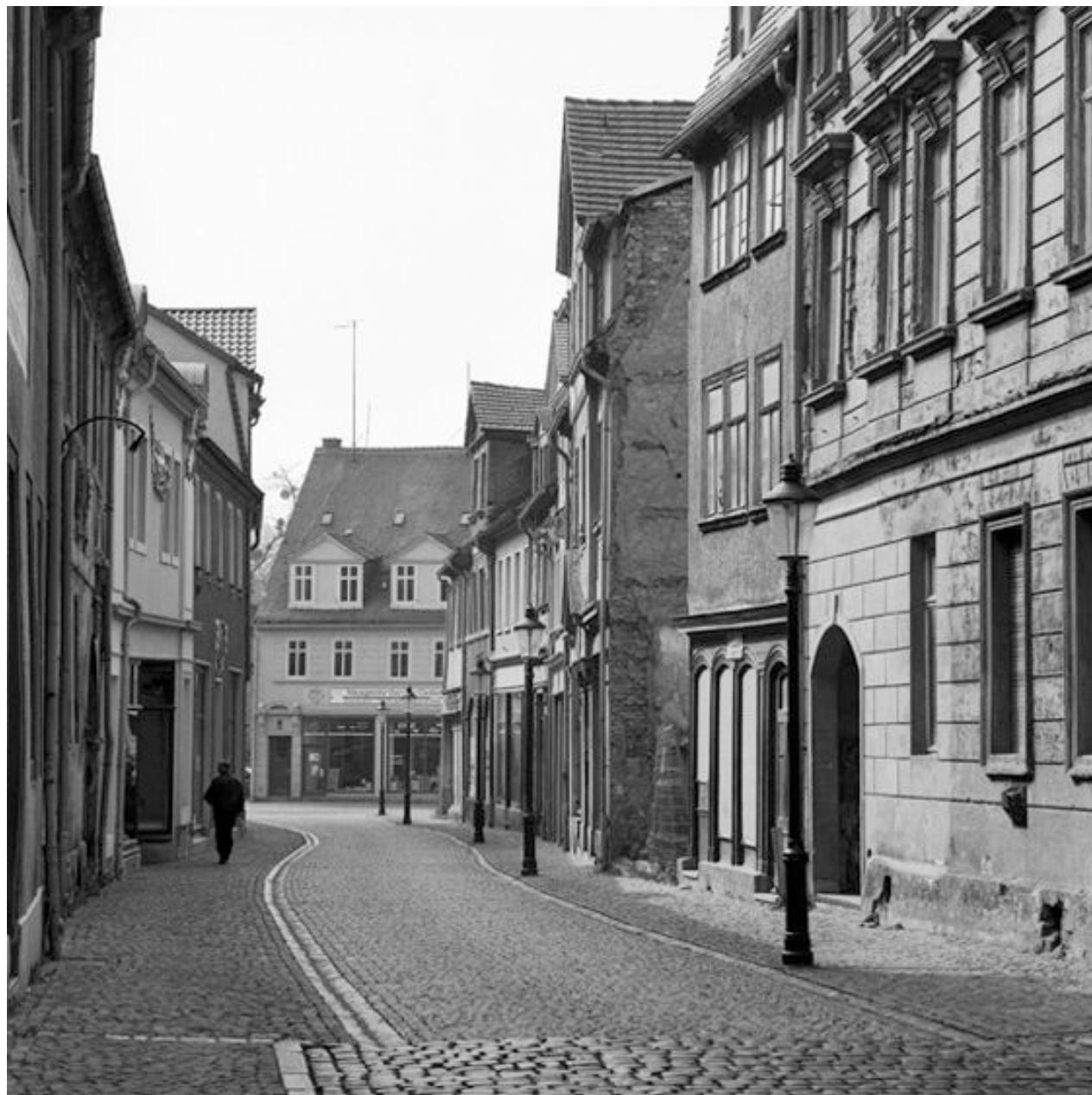
Thomas Steinert, Die Wenzelstraße bei Naumburg , 1990–95, Silver Gelatin Print, 40 x 40 cm, Edition 7

Diese neunzehn Fotografien entstanden zwischen 1990 und 1995, und sind Bestandteil eines Buchesprojektes über den Lebensweg von Friedrich Nietzsche. Im Kapitel über seine Jugend wird auch die Geschichte der schicksalhaften Begegnung mit Ernst Ortlepp ausführlich abgehandelt und mit diesen Bildern illustriert werden. Das 600. Gründungsjubiläum der Alma Mater Lipsiensis, an welcher beide studierten, ist der Anlass, sie erstmals zu veröffentlichen.