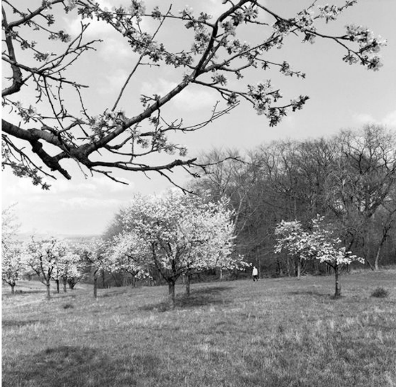
Thomas Steinert, Eine Obstplantage bei Almrich , 1990–95, Silver Gelatin Print, 40 x 40 cm, Edition 7

Foto-Essay über die letzten Lebensjahre des Dichters Ernst Ortlepp [1800—1864]