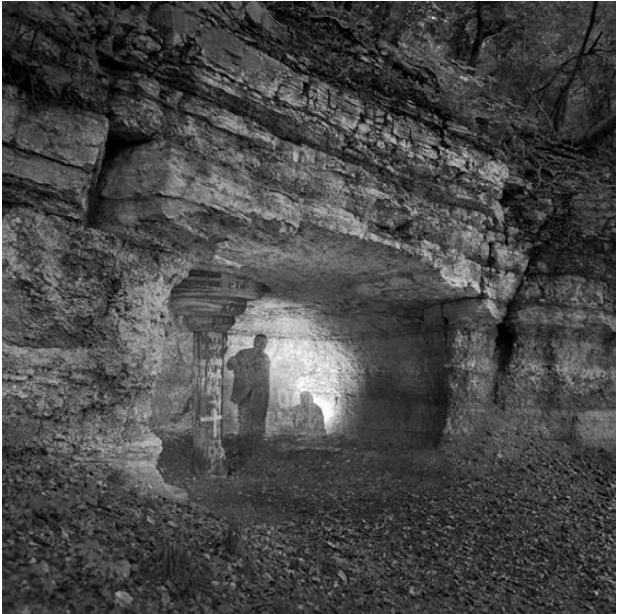
Thomas Steinert, Die »Musengrotte« bei Naumburg , 1990–95, Silver Gelatin Print, 40 x 40 cm, Edition 7

Foto-Essay über die letzten Lebensjahre des Dichters Ernst Ortlepp [1800—1864]