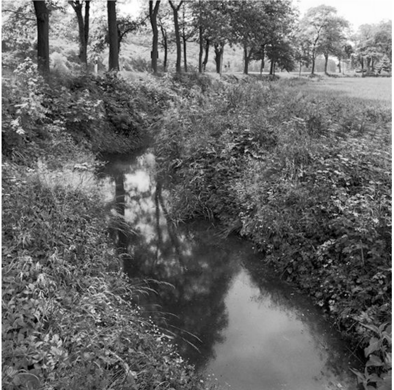
Thomas Steinert, Ein Entwässerungsgraben an der Straße nach Pforta, wenige Meter hinter der Ortsgrenze von Almrich , 1990–95, Silver Gelatin Print, 40 x 40 cm, Edition 7

Foto-Essay über die letzten Lebensjahre des Dichters Ernst Ortlepp [1800—1864]