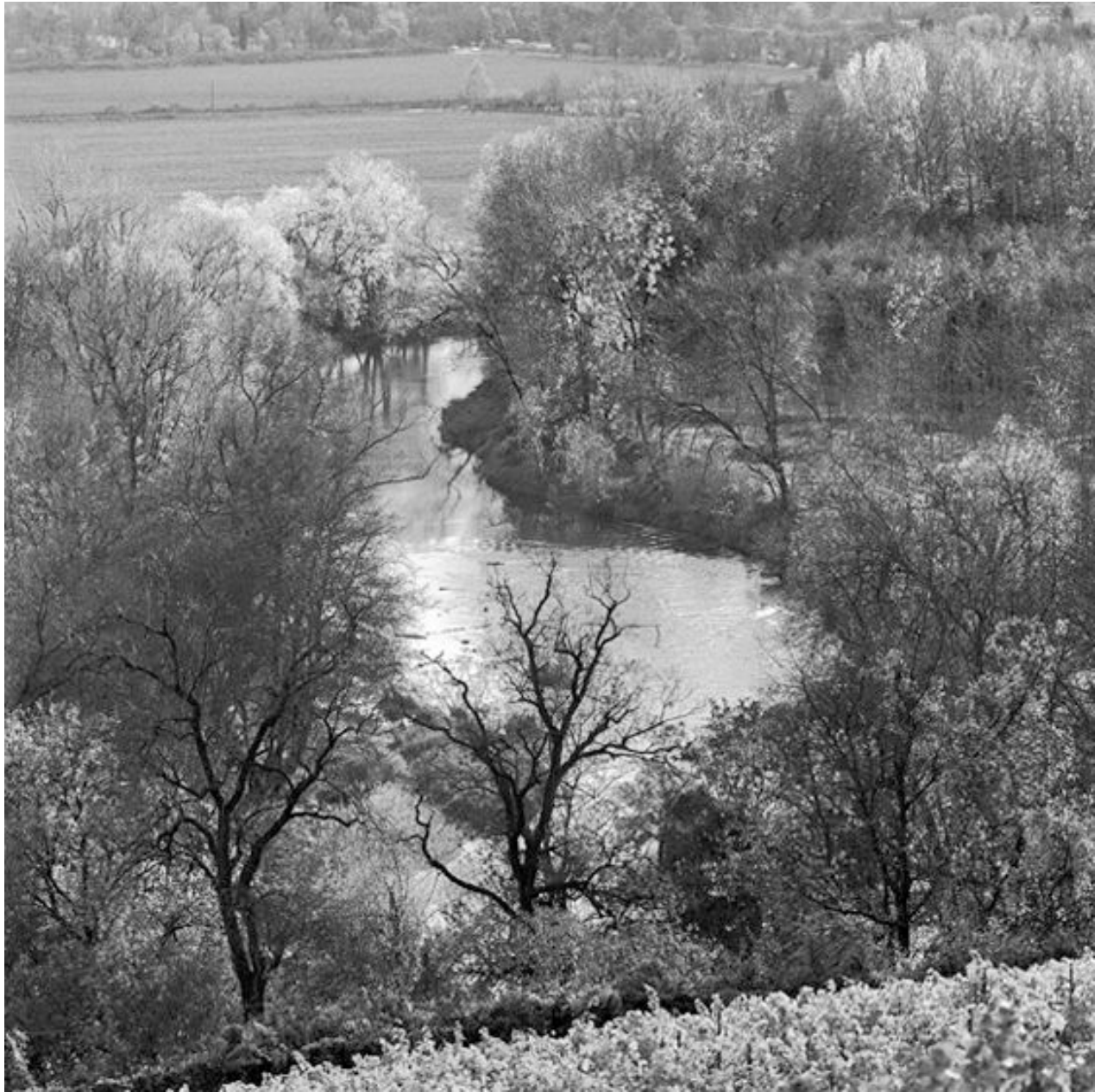
Thomas Steinert, Die Saale bei Saalbäuser , 1990–95, Silver Gelatin Print, 40 x 40 cm, Edition 7

Foto-Essay über die letzten Lebensjahre des Dichters Ernst Ortlepp [1800—1864]