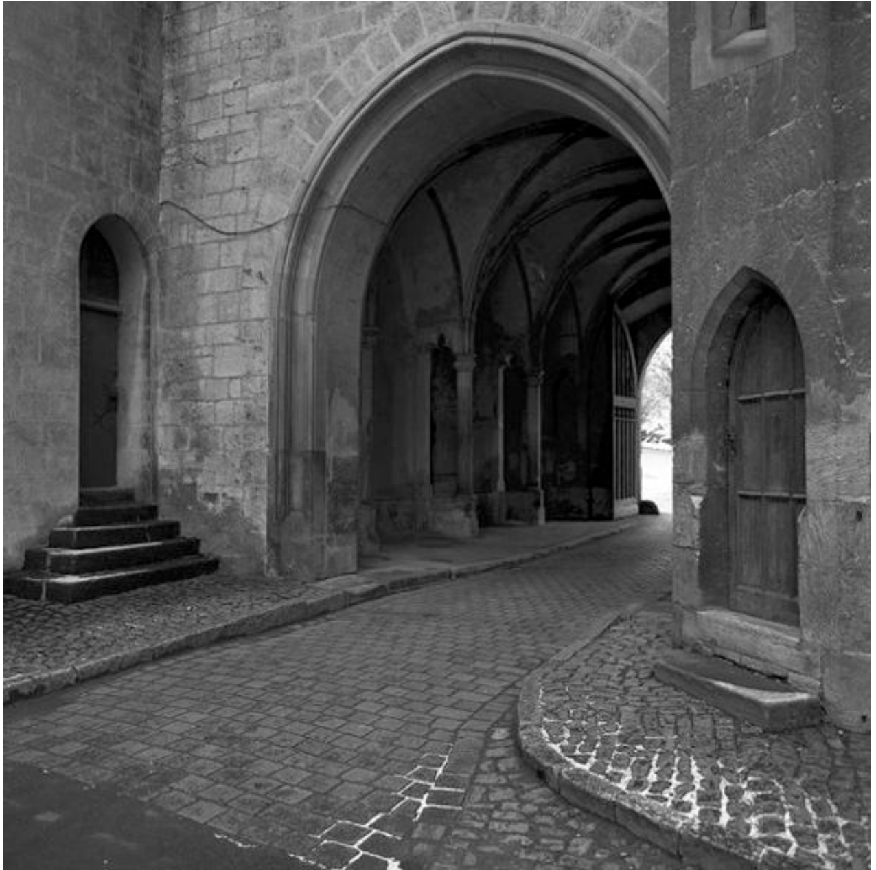
Thomas Steinert, Das Eingangstor von Schulpforta , 1990–95, Silver Gelatin Print, 40 x 40 cm, Edition 7

Foto-Essay über die letzten Lebensjahre des Dichters Ernst Ortlepp [1800—1864]