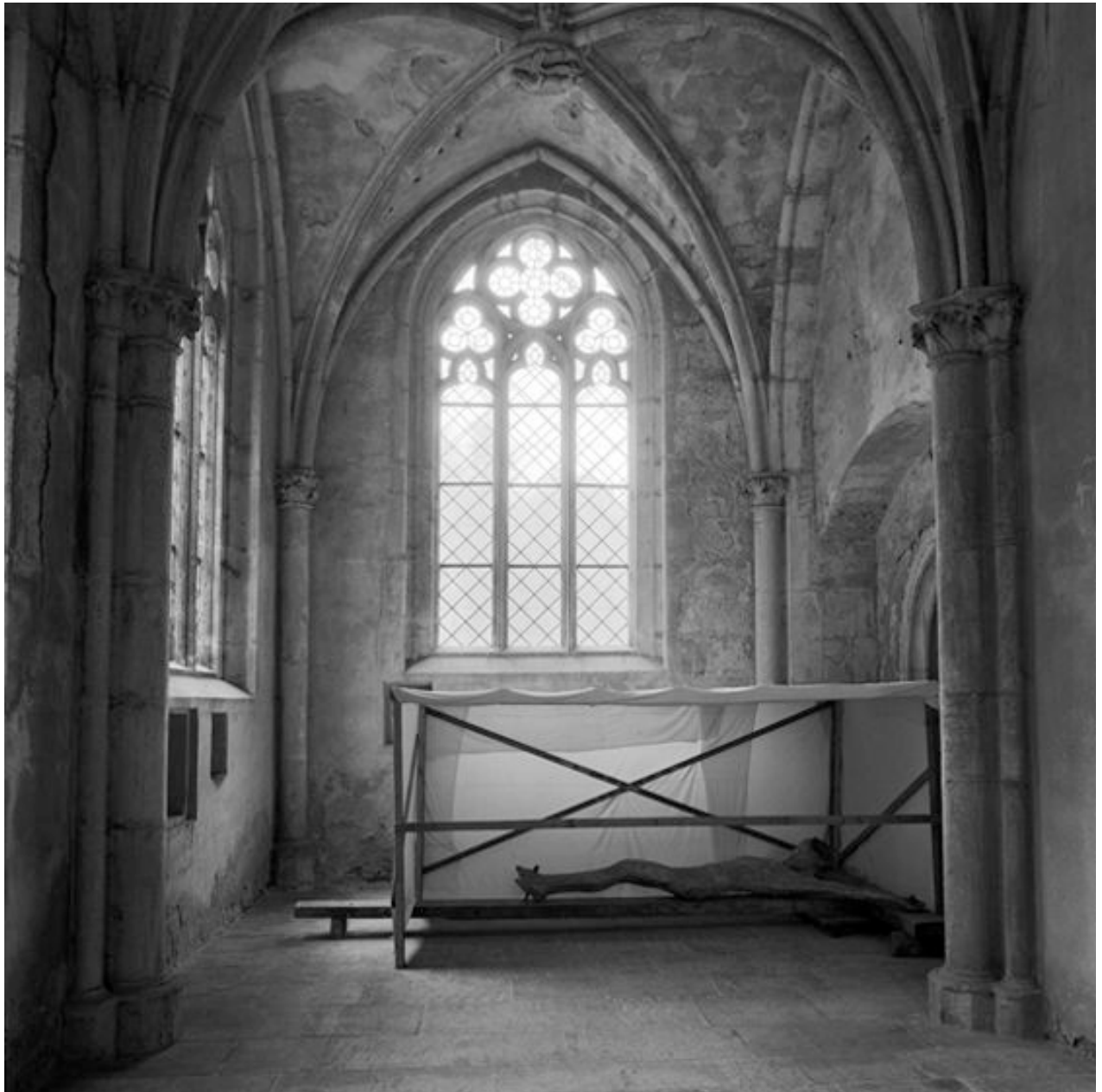
Thomas Steinert, In der Klosterkirche Pforta , 1990–95, Silver Gelatin Print, 40 x 40 cm, Edition 7

Foto-Essay über die letzten Lebensjahre des Dichters Ernst Ortlepp [1800—1864]