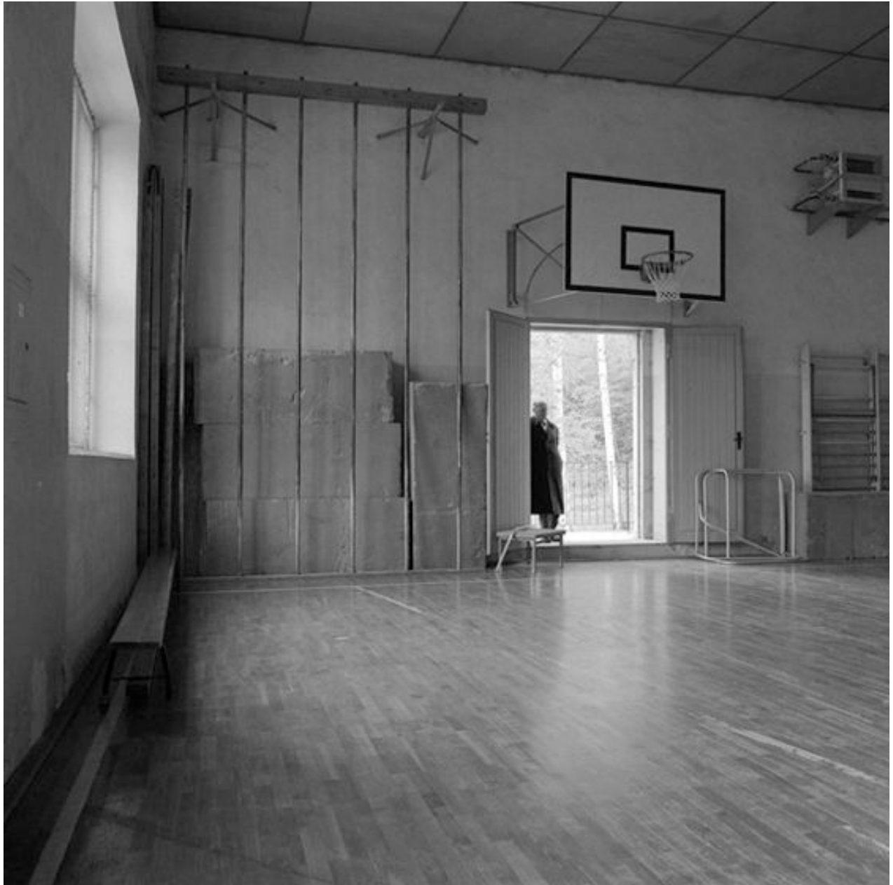
Thomas Steinert, In der Turnhalle von Schulpforta , 1990–95, Silver Gelatin Print, 40 x 40 cm, Edition 7

Foto-Essay über die letzten Lebensjahre des Dichters Ernst Ortlepp [1800—1864]