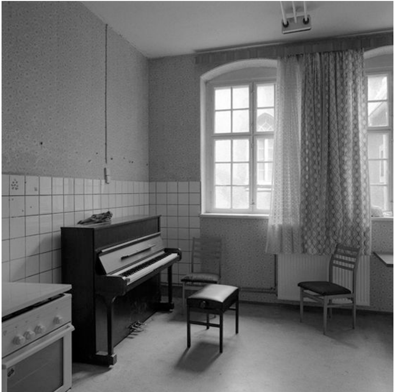
Thomas Steinert, Die Teeküche in Pforta , 1990–95, Silver Gelatin Print, 40 x 40 cm, Edition 7

Foto-Essay über die letzten Lebensjahre des Dichters Ernst Ortlepp [1800—1864]