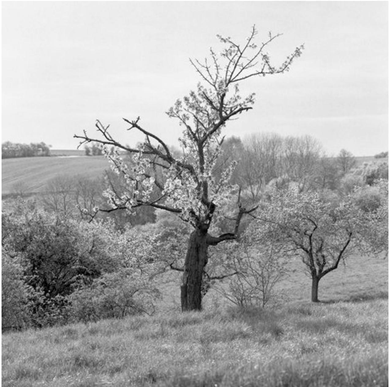
Thomas Steinert, Im Wehbaual , 1990–95, Silver Gelatin Print, 40 x 40 cm, Edition 7

Foto-Essay über die letzten Lebensjahre des Dichters Ernst Ortlepp [1800—1864]