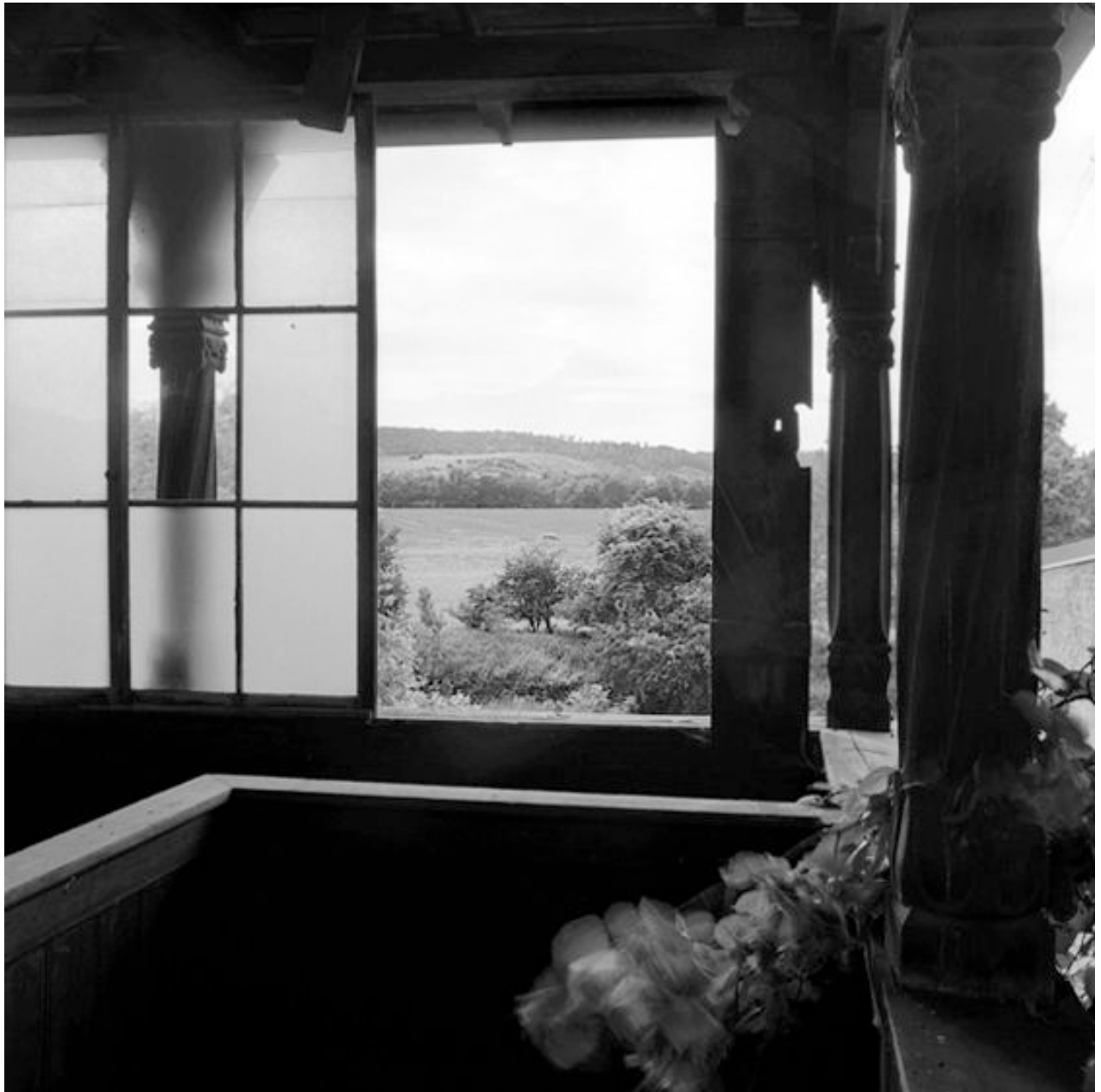
Thomas Steinert, In der Weinlaube des Gasthauses Saalhäuser , 1990–95, Silver Gelatin Print, 40 x 40 cm, Edition 7

Foto-Essay über die letzten Lebensjahre des Dichters Ernst Ortlepp [1800—1864]