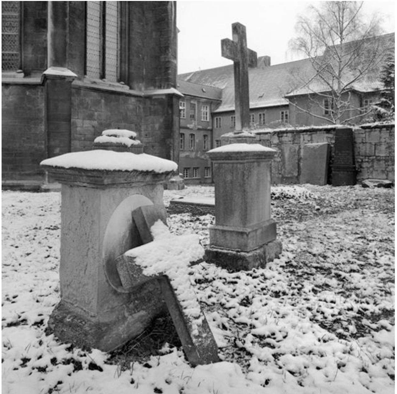
Thomas Steinert, Der Friedhof von Pforta , 1990–95, Silver Gelatin Print, 40 x 40 cm, Edition 7

Foto-Essay über die letzten Lebensjahre des Dichters Ernst Ortlepp [1800—1864]