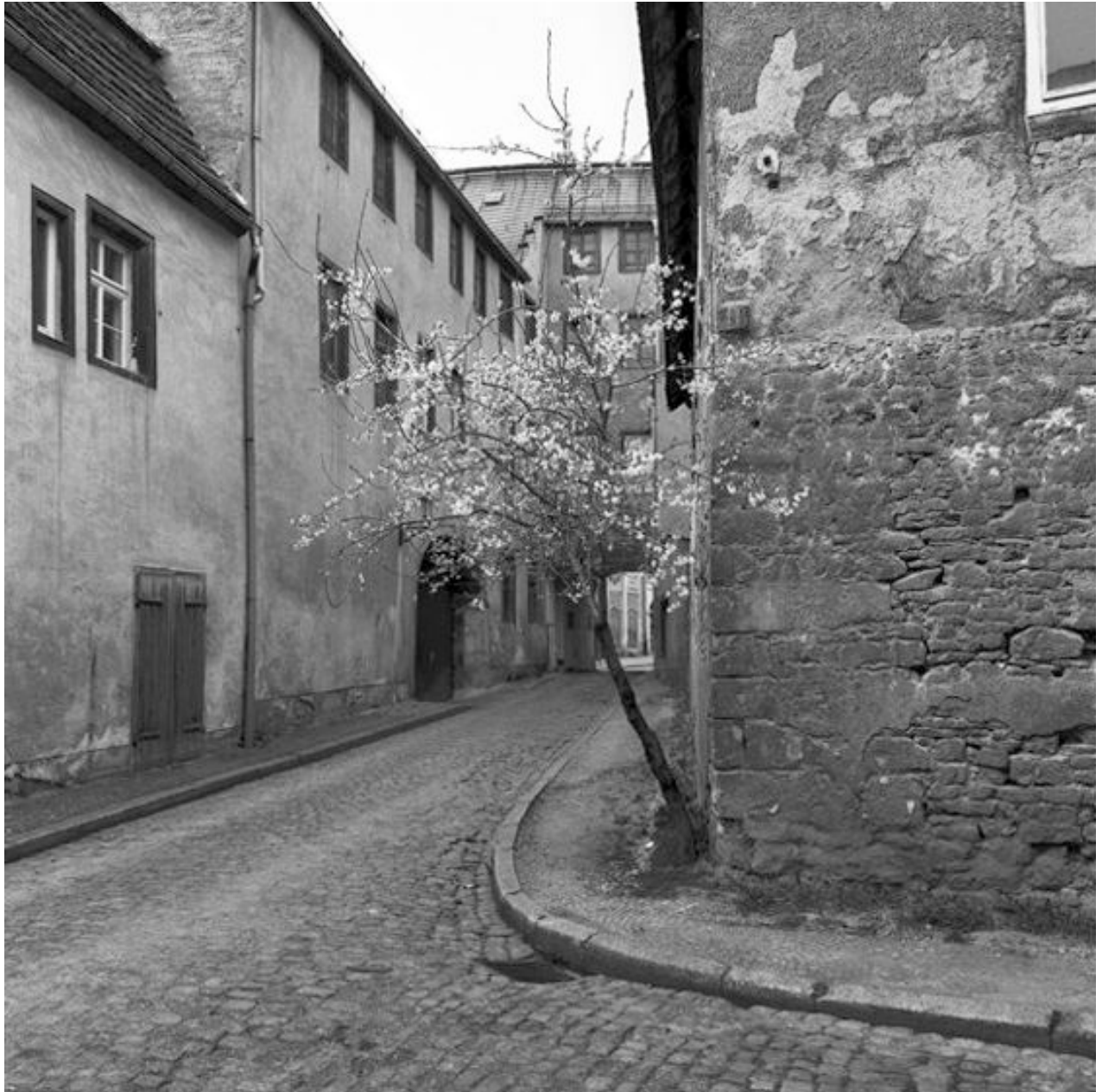
Thomas Steinert, Die Jüdengasse mit dem Durchgang zum Topfmarkt in Naumburg , 1990–95, Silver Gelatin Print, 40 x 40 cm, Edition 7

Foto-Essay über die letzten Lebensjahre des Dichters Ernst Ortlepp [1800—1864]