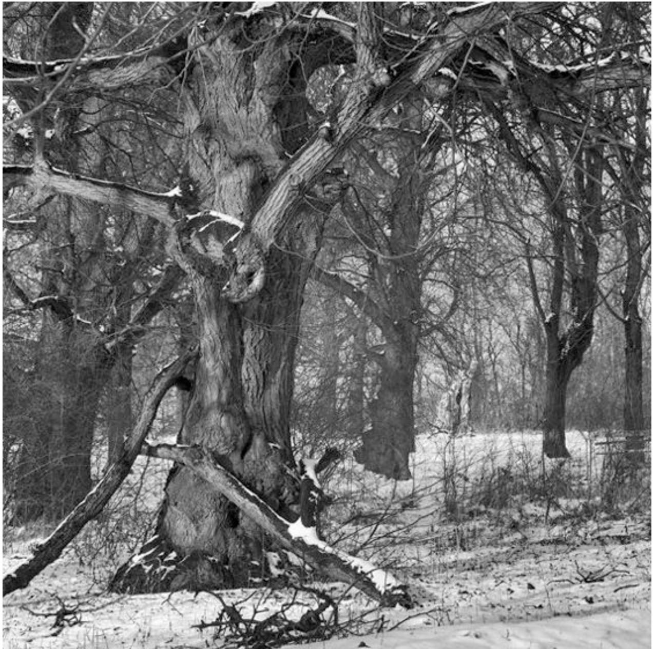
Thomas Steinert, Die Festwiese auf dem Knabenberg bei Pforta , 1990–95, Silver Gelatin Print, 40 x 40 cm, Edition 7

Foto-Essay über die letzten Lebensjahre des Dichters Ernst Ortlepp [1800—1864]